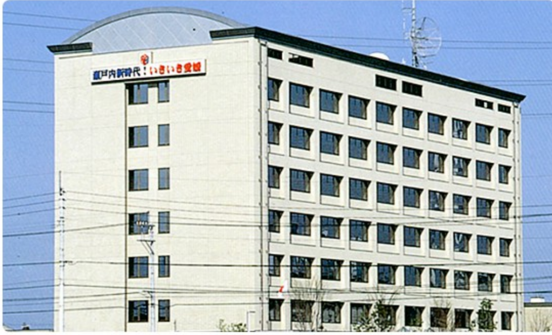
愛媛県西条地方局庁舎