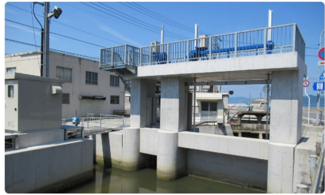
水門ローラーゲート