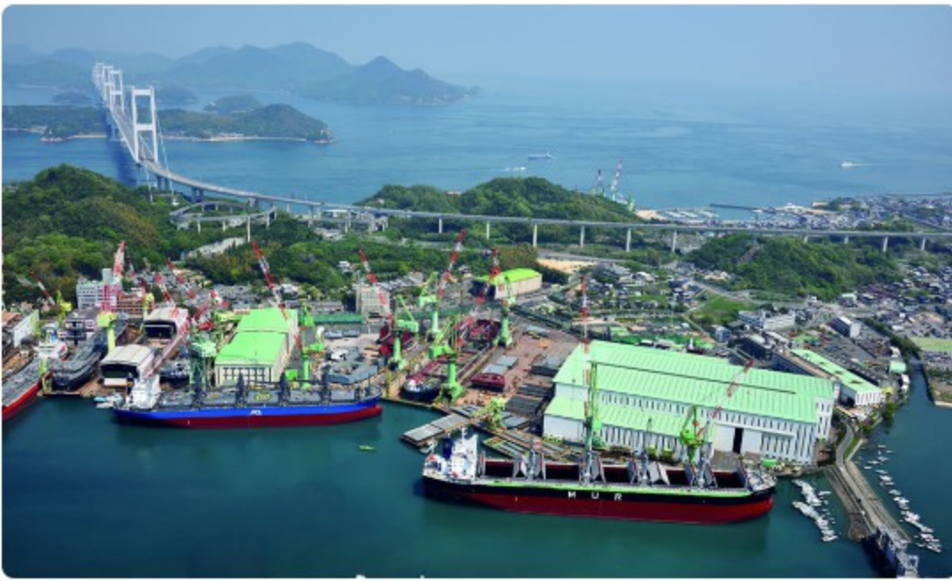
今治造船本社工場