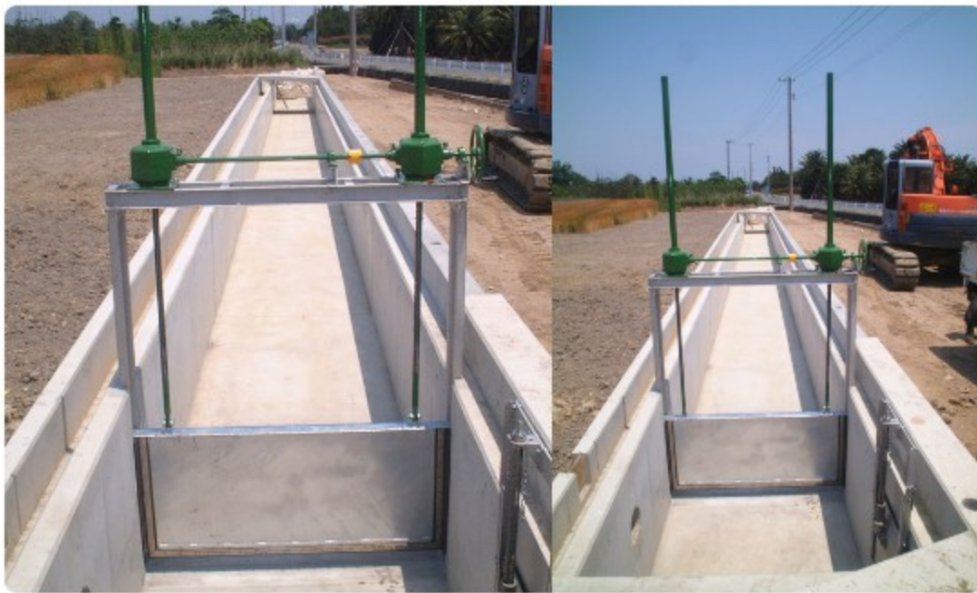
水門スライドゲート