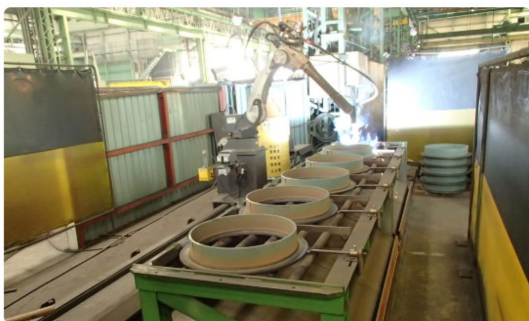
マンホール枠 ロボット溶接