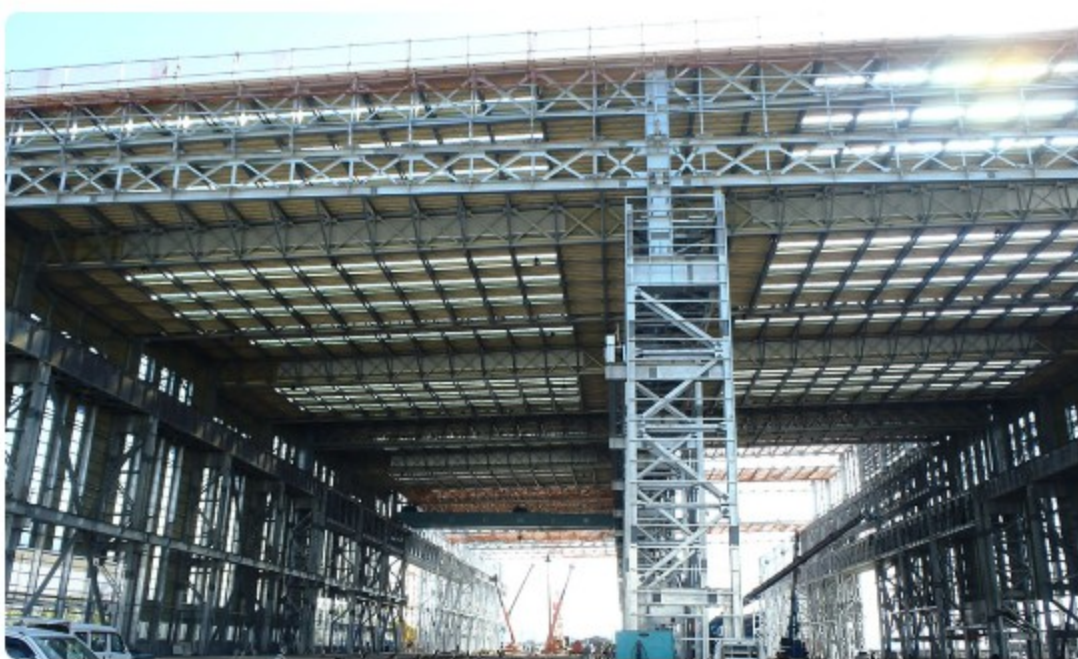
今治造船 丸亀南組立工場内部