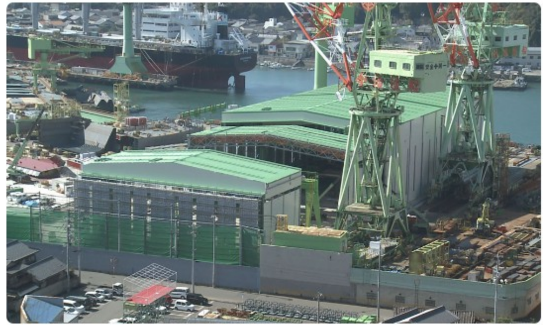
今治造船本社工場 移動建屋