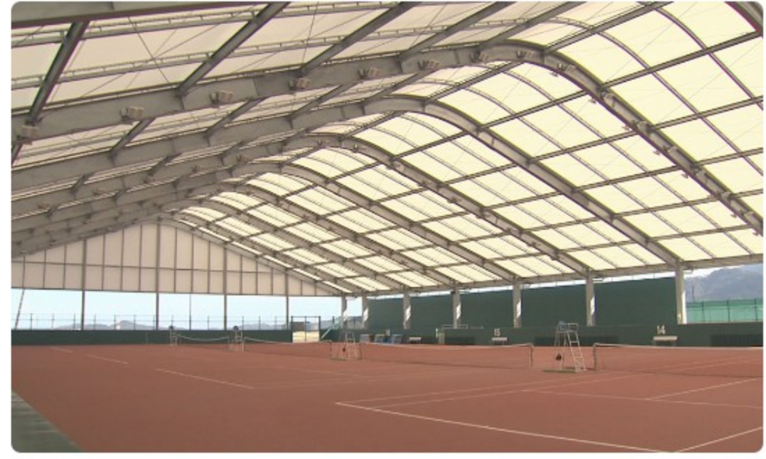
今治新都市スポーツパーク屋内テニスコート