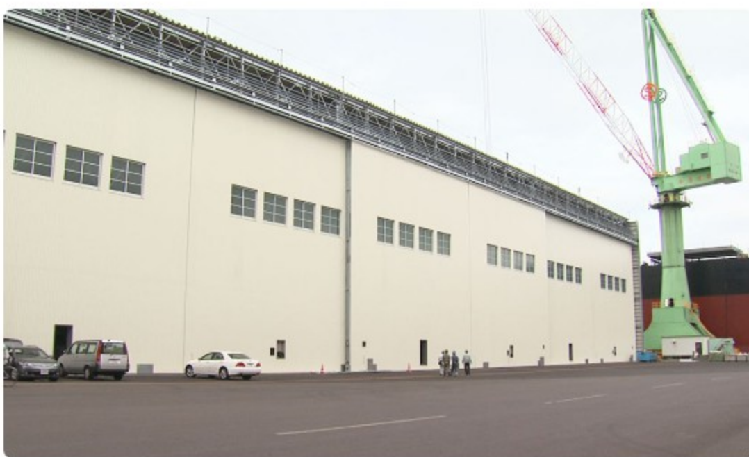
今治造船西条工場西塗装工場