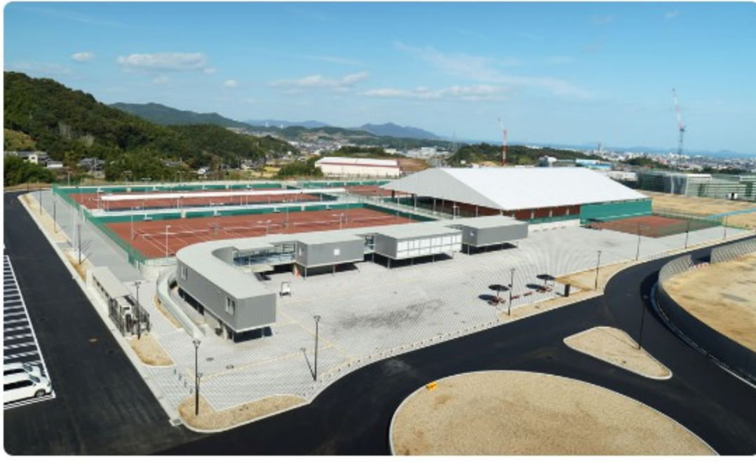
今治新都市スポーツパークテニス施設