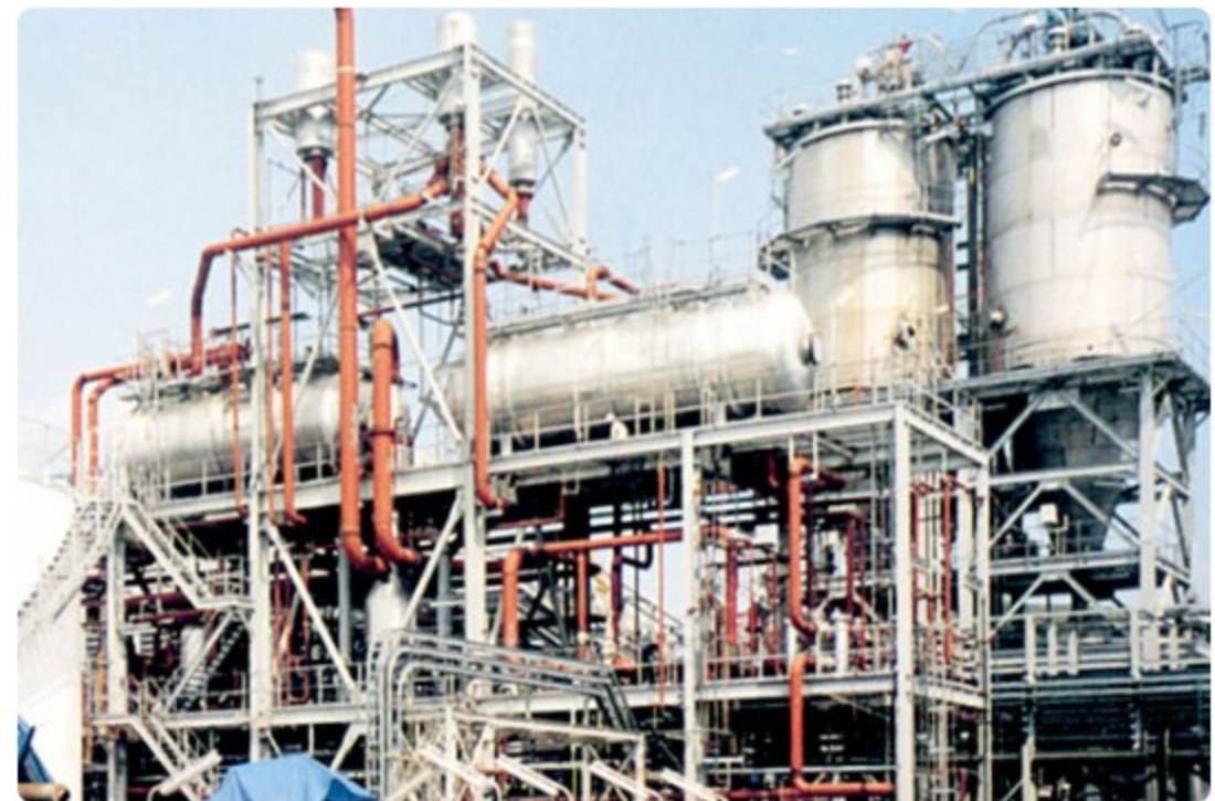
インドネシア火力プラント