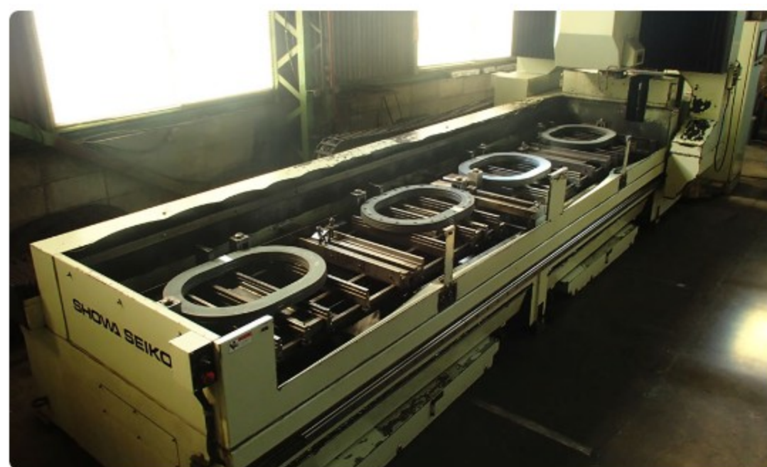
マンホール 自動穴明・タップ