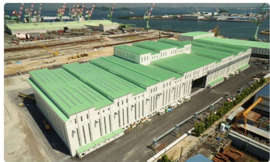
今治造船 丸亀南組立工場