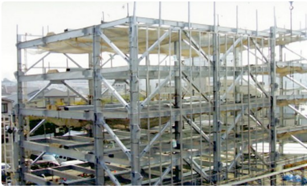
立体駐車場 (大阪市豊島区(建設中))