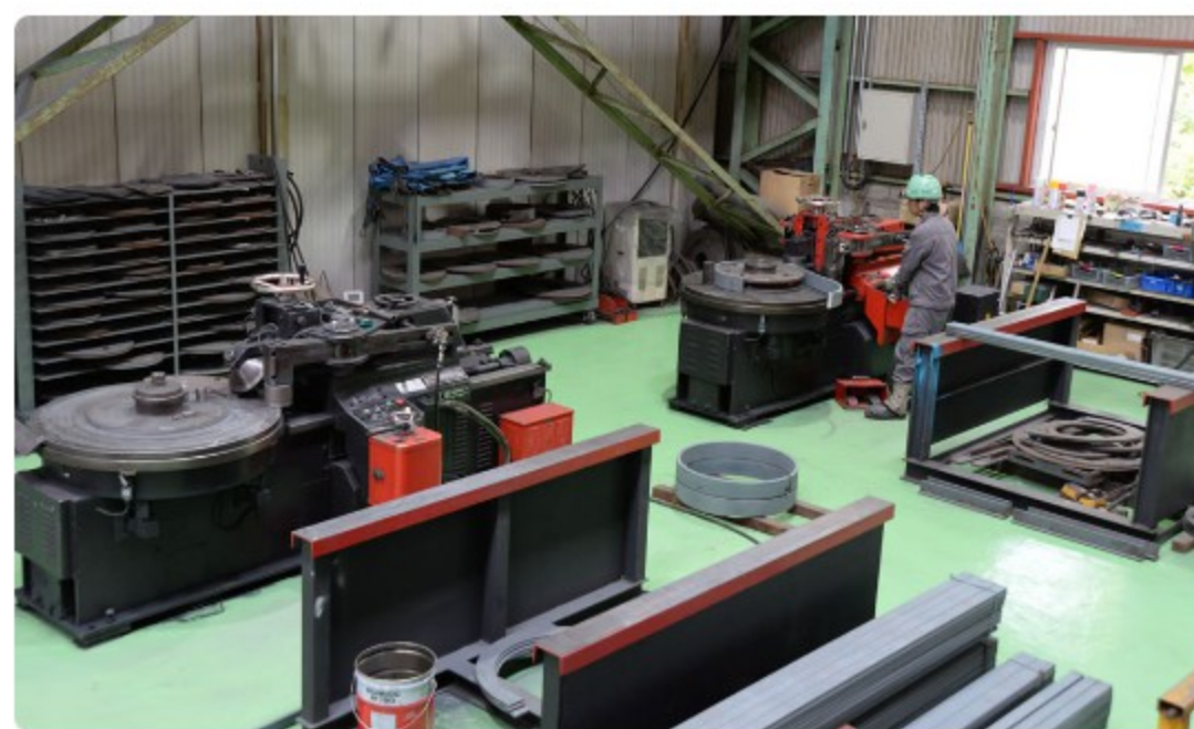
マンホール曲げ加工

船舶に使われるマンホール。ここでは、ムダのない独自の工法で鉄板を曲げ、スクラップ率を減少させるなど効率性、経済性を高めています。さらに、高度な産業用ロボットを導入し、作業の自動化も進めています。