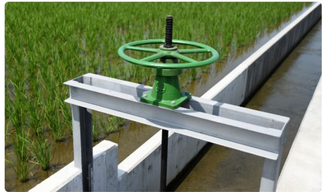
スライドゲート開閉装置