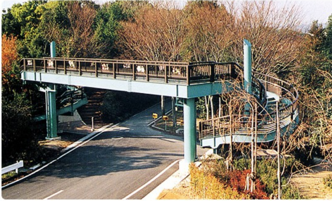
鹿ノ子池公園歩道橋