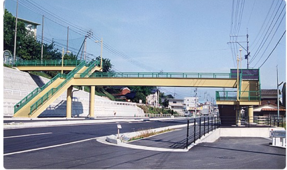
近見小学校前歩道橋