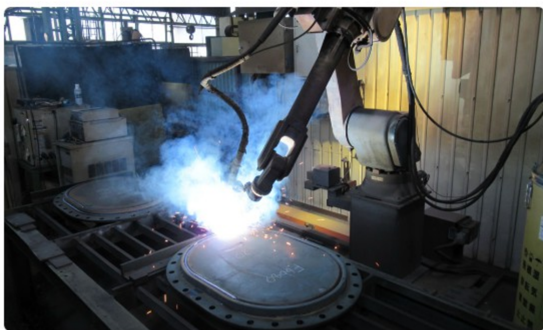
マンホールフタ ロボット溶接