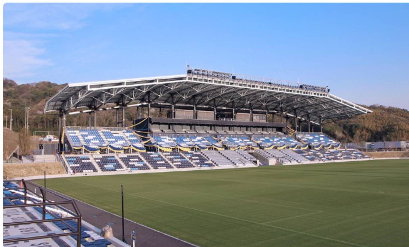
今治里山スタジアム