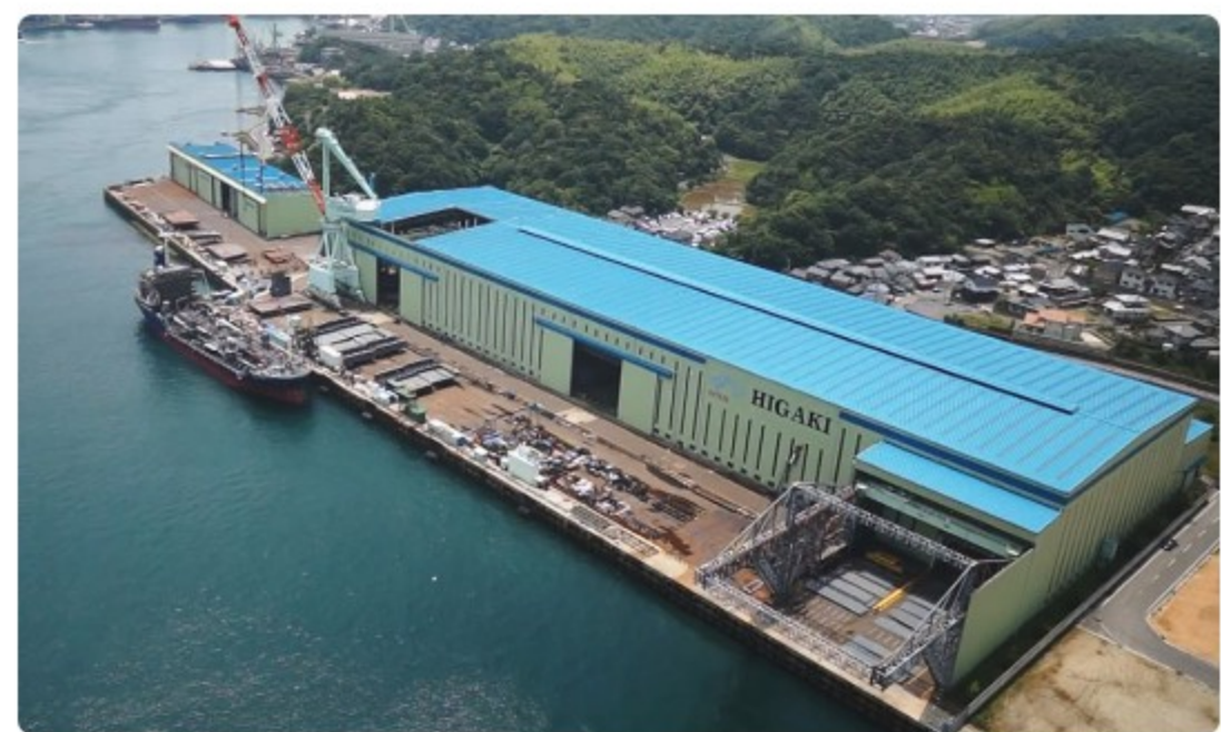
檜垣造船波方工場