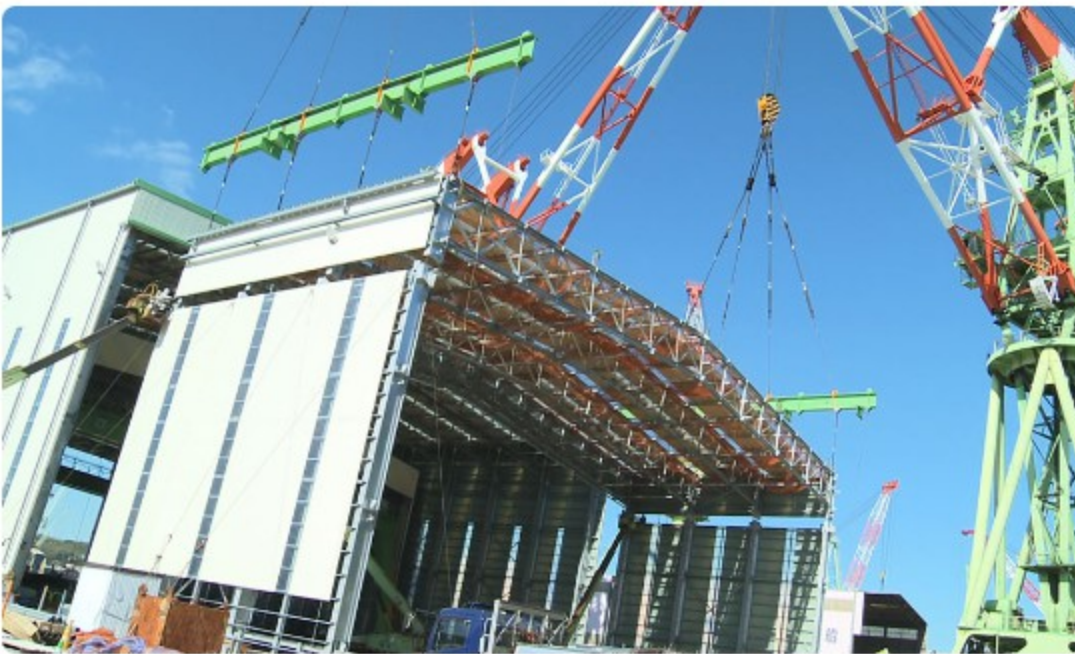
今治造船本社工場 移動建屋 建設中