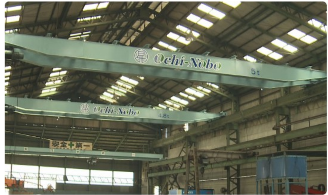
越智昇鉄工本社工場 天井クレーン