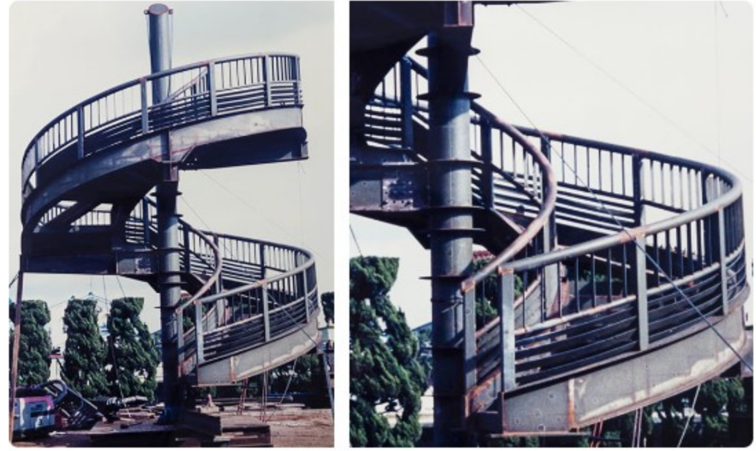
鹿ノ子池公園歩道橋螺旋階段